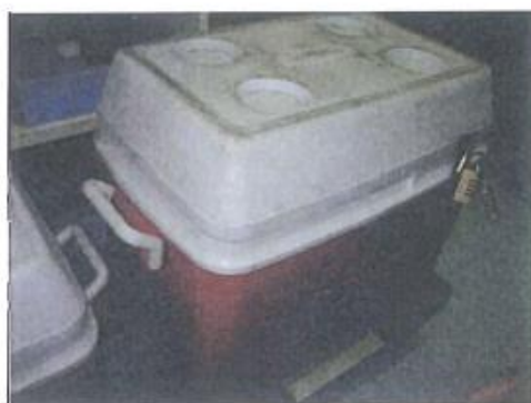
獨立樣本存放的冰箱(連鎖)