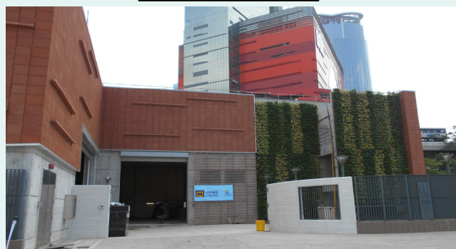
污水截流站的綠化牆身