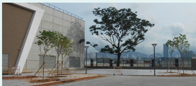
截流站外圍的綠化種植工作