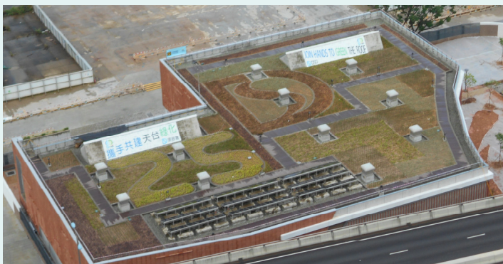
污水截流站的綠化天台