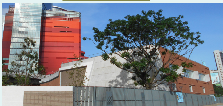
苦楝樹的永久位置