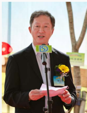
渠務署署長陳志超太平紳士致歡迎辭

本署於2011年11月16日舉辦西貢福民路植樹日，渠務署署長陳志超太平紳士，吳仕福SBS，太平紳士，發展局工務科文物、計劃及資源管理部、西貢鄉事委員會、土木工程拓展署、博威(B&V)和俊和代表一起為活動擔任主禮嘉賓。渠務署署長陳志超太平紳士在活動開始時向各位嘉賓致歡迎辭並向各位來賓預告在今年年中，西貢市將會增添一個約4000平方米的公園，並將成為西貢市中心一個新地標。