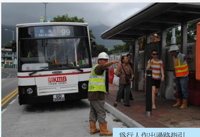
為行人作出過路指引