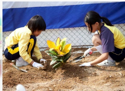
學生植樹並灌溉植物