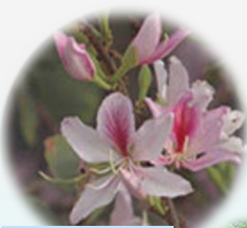
宮粉羊蹄甲 Bauhinia variegata

我們在新公園中將會種植約一百棵不同品種的樹木，其中的中型樹木有宮粉羊蹄甲、桂花、黃金蒲桃及水石榕等。種植大量樹木便可美化西貢環境，也可改善空氣質素。