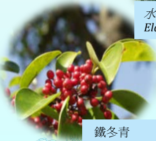
鐵冬青 Ilex rotunda