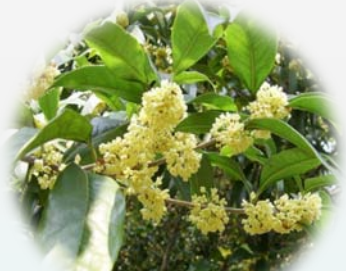
桂花 Osmanthus fragrans