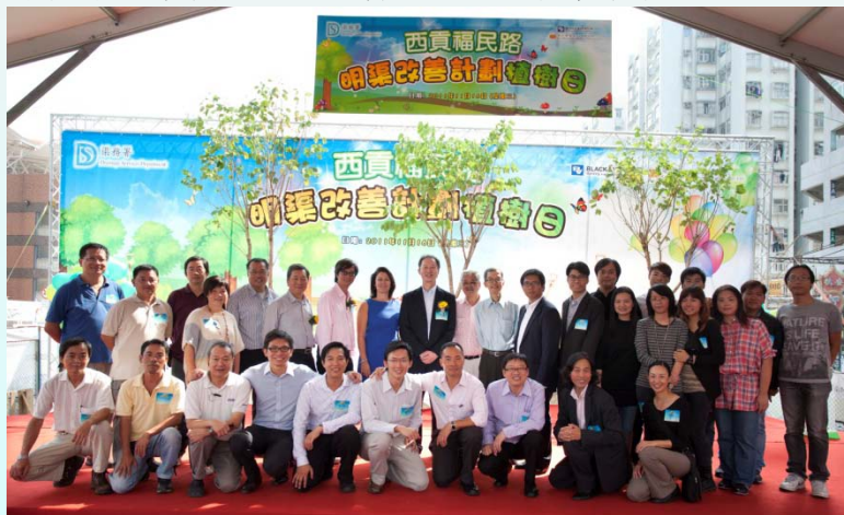
上圖—工程團隊大合照

我們非常感謝西貢民政事務處、西貢鄉事委員會、西貢飲食業協會、水務署和香港警務處等代表出席植樹日。另外，去年參與本署舉辦「我理想中的西貢市」為題繪畫比賽的其中兩所學校—西貢崇真天主教學校(小學部)和天主教聖安德肋小學也應邀參與植樹活動，並透過是次活動向學生灌輸正面的環保訊息及喚醒他們對生態環境的關注。