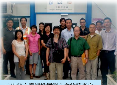
出席龍舟雕塑投標簡介會的藝術家